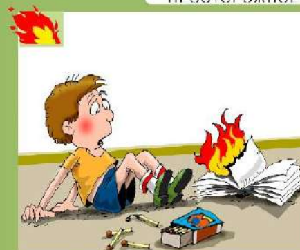
ДЕТСКАЯ ШАПОСТЬ С ОГНЕМ