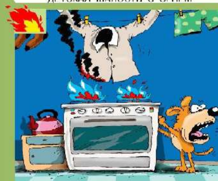
НАРУШЕНИЕ ПРАВИЛ ПОЖАРНОЙ БЕЗОПАСНОСТИ ПРИ ЭКСПЛУАТАЦИИ ГАЗОВОГО И ЭЛЕКТРИЧЕСКОГО ОБОРУДОВАНИЯ