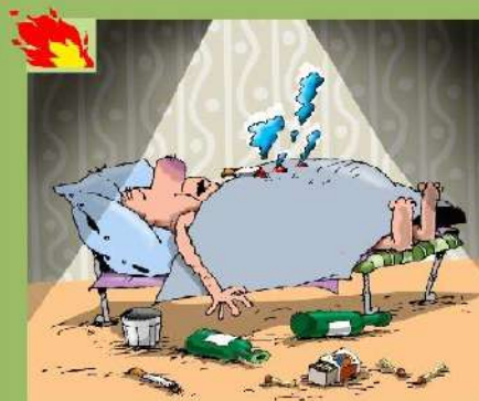
НЕОСТОРОЖНОЕ ОБРАЩЕНИЕ С ОГНЕМ