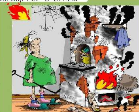
НЕИСПРАВНОСТЬ ПЕЧИ И ИХ НЕПРАВИЛЬНАЯ ЭКСПЛУАТАЦИЯ