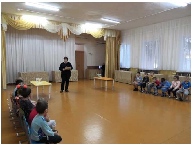
Фото - отчёт: